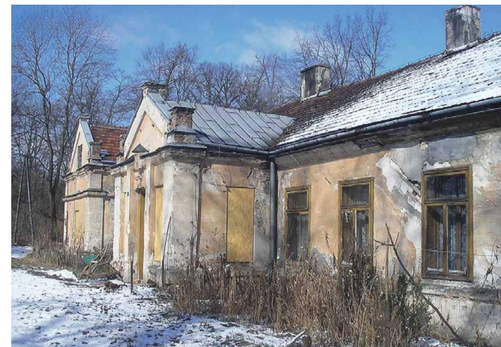
Dworek Mieroszewskiego w Czechach

Odziedziczył ordynację myśliwską po śmierci ojca w 1806 roku. Do majątku doszły też Krzcięcice powiat Jędrzejów i Malukowice w powiecie Kazimierza Wielka. Do stycznia 1816 r. przebywał na wsi. Po tem wznowia swoją działalność publiczną. Został sędzią pokoju i przewodniczącym Komitetu Prawodawczego przy Izbie Reprezentantów Wolnego Miasta Krakowa. W 1823 roku założono kopalnię „Ferdi-