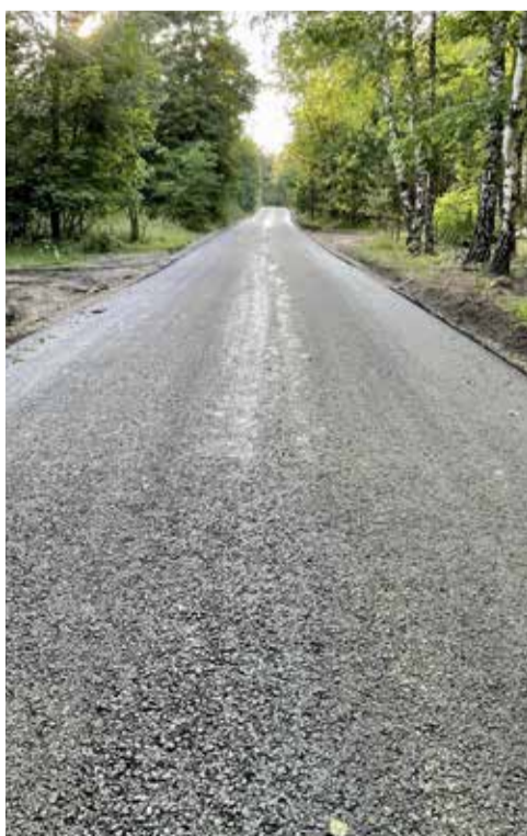
Siewierz, ul. Parkowa