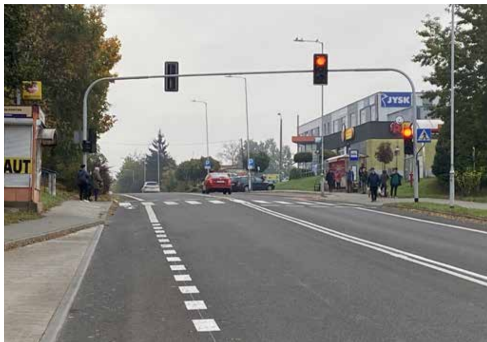
Będzin, ul. Piłsudskiego

W grudniu zostaną oddane kolejne odcinki dróg powiatowych np. ul. Nowopogońska w Czeladzi i ul. Wojska Polskiego w Będzinie.