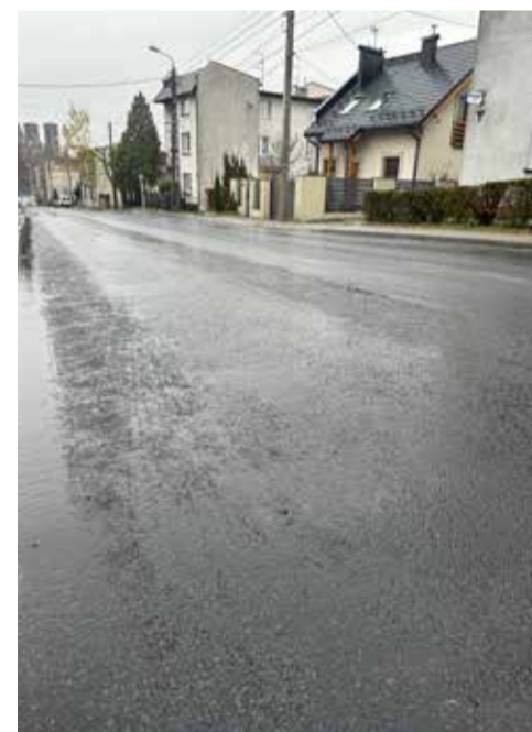
Czeladź, ul. Mysłowicka