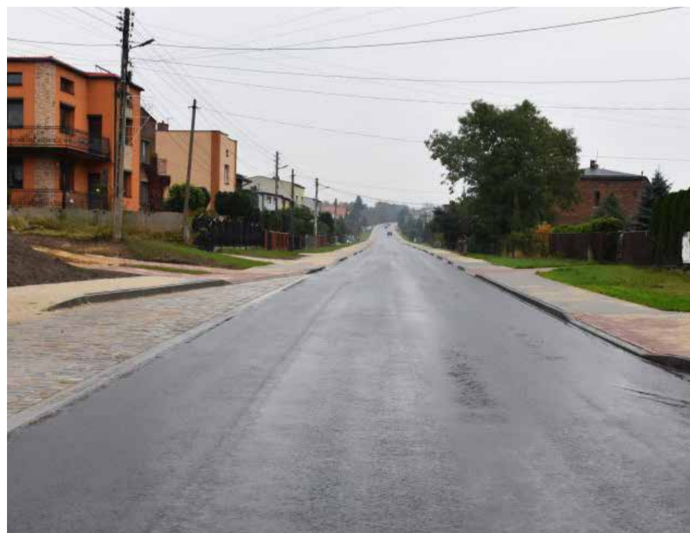
Bobrowniki, ul. 27 stycznia