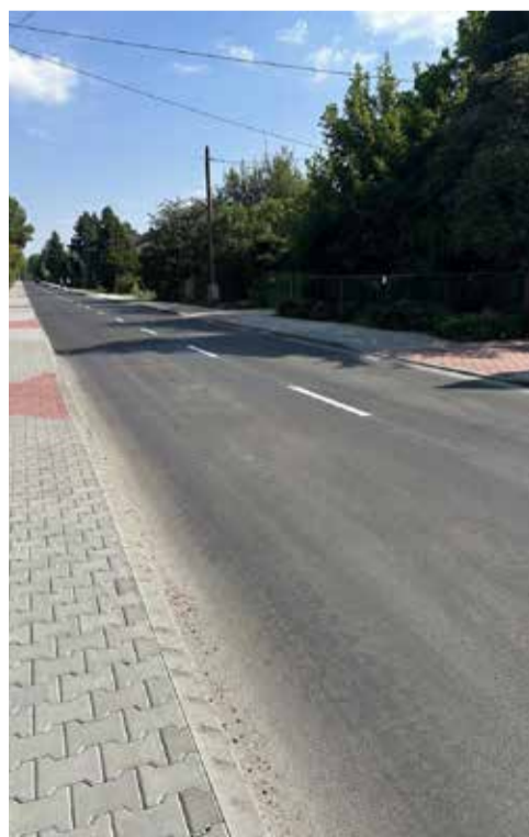
Będzin, ul. Dąbrowska