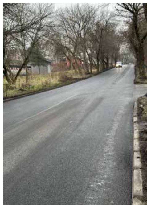
Czeladź, ul. Nowopogońska