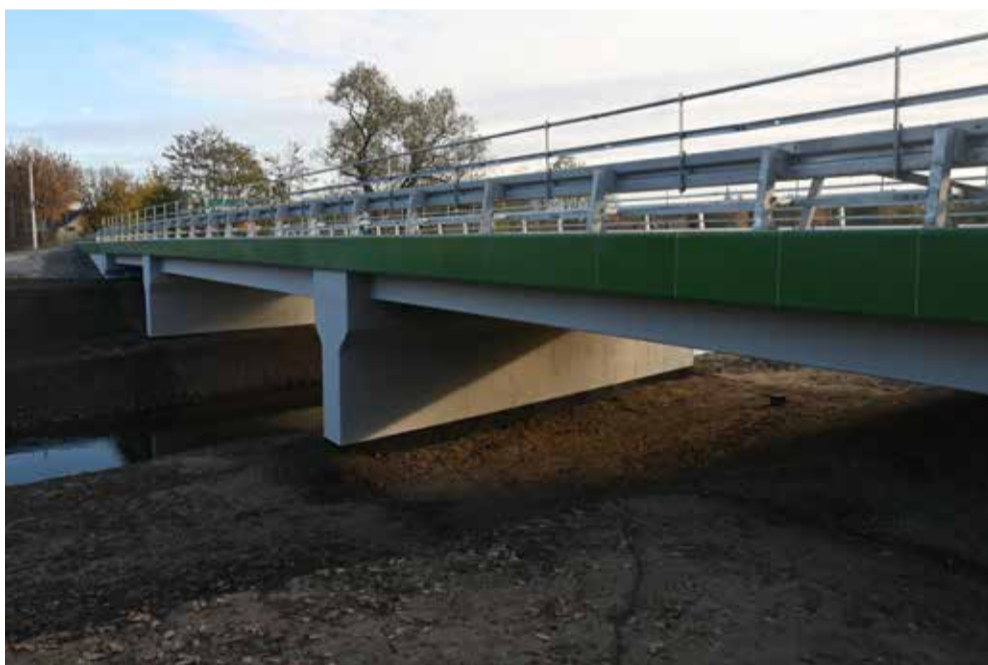
Most w Preczowie