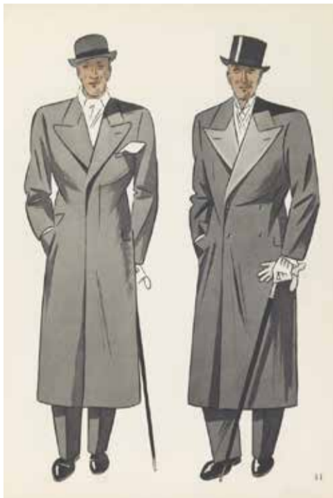
Płaszcz popołudniowy (po lewej) i wieczorowy (po prawej), „Wykwint i Moda” nr 2, 1937 rok

Landrat mjr Büchting, objął urząd starosty będzińskiego po ustępującym landracie Wellekampcie. Czas jego kadencji przypada na okres, kiedy to w 1915 roku tereny Będzina należały do okupacji niemieckiej. Warto przypomnieć, iż terytorium Zagłębia stało się granicą między dwiema strefami okupacyjnymi: austriacką (Dąbrowa, Zagórze, Zawiercie) i niemiecką (Będzin, Sosnowiec, Czeladź).