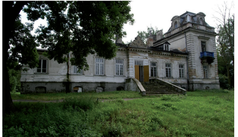
Pałacyk Koziatulskich w Kozietulach