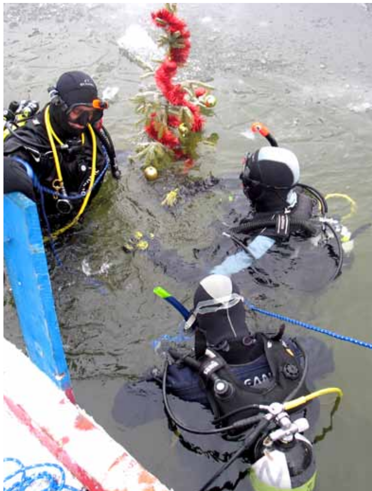
Podwodna wigilia nurków na rogożnickim zalewie.

Co roku wodniacy i nurkowie spotykają się nad akwem Rogoźnik, aby wspólnie zejść pod wodę z symboliczną choinką, świątecznie podzielić się opłatkiem z rodzinami i przyjaciółmi, a także uratować karpia - szczęśliwcowi życie. W tym roku dołączyli do nich uczniowie klas pożarniczych Liceum Ogólnokształcącego w Wojkowicach, szkoły w której została powołana Sekcja Nurkowa.