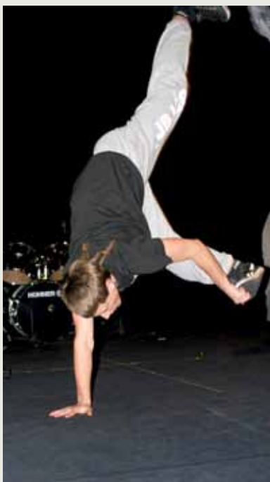
Podczas koncertu uczniowie „Wyspiana” prezentowali m.in. swoje umiejętności taneczne.

Słowo „amatorskie” nie wydaje się jednak tu na miejscu. Ktokolwiek miał przyjemność wysłuchania chociażby części tego przedsięwzięcia i obserwowania pasji, z jaką występujący realizują swoje marzenia daleki byłby od określania tego, co widzi słowem „amatorski”. Wprawdzie wszystko, co goście mogą