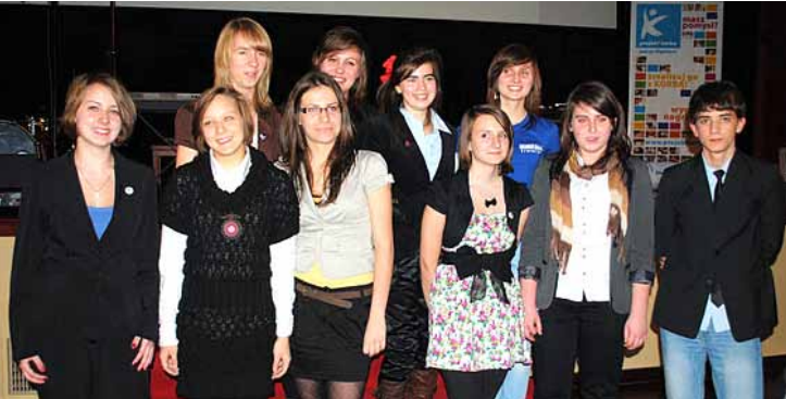
Laureaci projektu Korba podczas uroczystej gali.