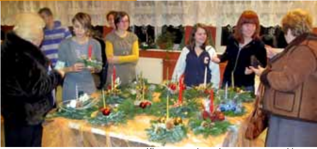
Kiermasz podczas koncertu na rzecz Liceum.