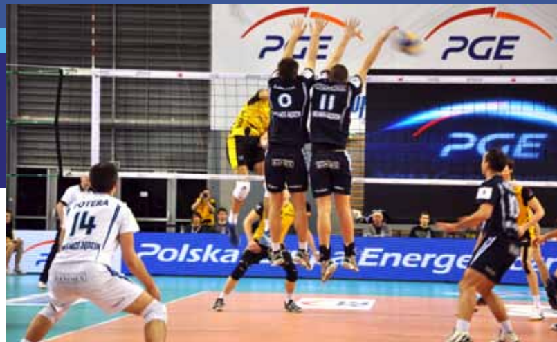
Mistrzowie Polski okazali się zbyt silnym rywalem dla będzińskich siatkarzy.

MKS MOS Interpromex Będzin nie sprostął wyzwaniu aktualnych mistrzów Polski PGE Skry Bełchatów i odpadł z dalszych rozgrywek pucharowych. Jednak kilka dni później zrewanżował się kibicom pokonując w spotkaniu ligowym ASPS Pekoł Ostrołękę 3:0, dzięki czemu awansował na piąte miejsce w tabeli.