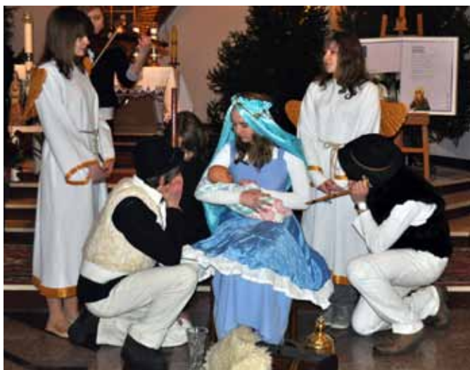
Widowisko zostało ciepło przyjęte przez dąbrowską publiczność.