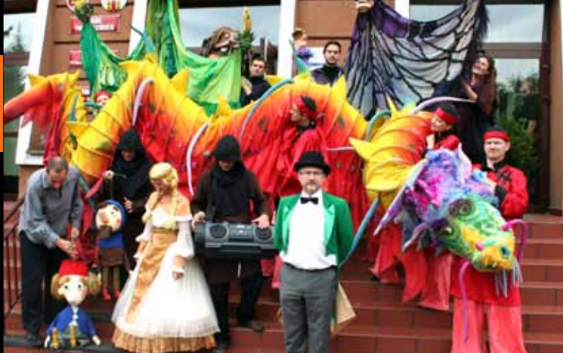
Aktorzy Teatru Dzieci Zagłębia organizują uliczne happeningi...