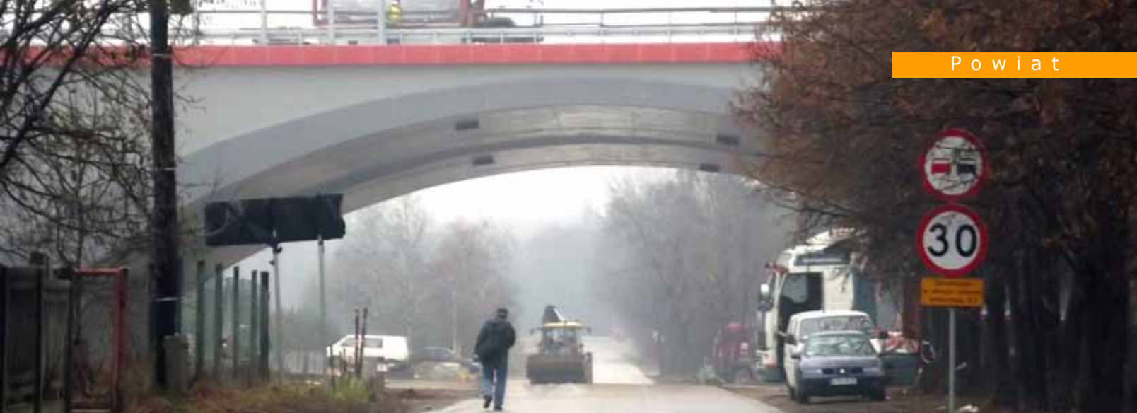
Jeden z naprawionych odcinków dróg w Bobrownikach.