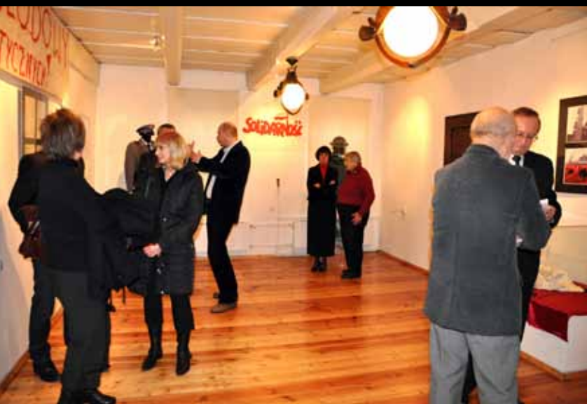
Oryginalna ekspozycja ciekawiła widzów.