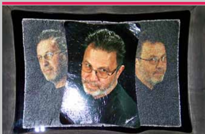
Tryptyk portretowy - autoportret Stanisława Michalskiego.