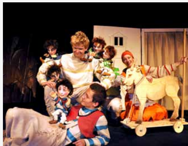
...jednak ich domeną są przedstawienia dla dzieci.