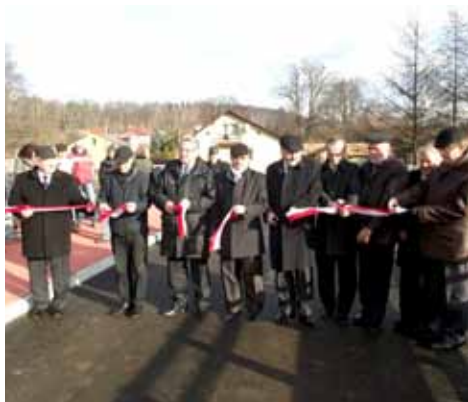
Uroczyste otwarcie mostu.

Ostatnie miesiące to czas zamykania powiatowych remontów. Ładna pogoda sprawiła, że prace można było prowadzić długo jeszcze po zakończeniu sezonu jesiennego.