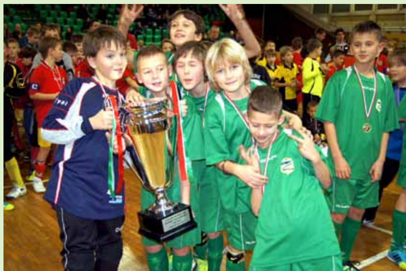
Młodzi trampkarze Górnika Sosnowiec mogli poczuć smak zwycięstwa.

Górnik Jaworzno Czarni Sosnowiec Warta Zawiercie Obita Bukowno