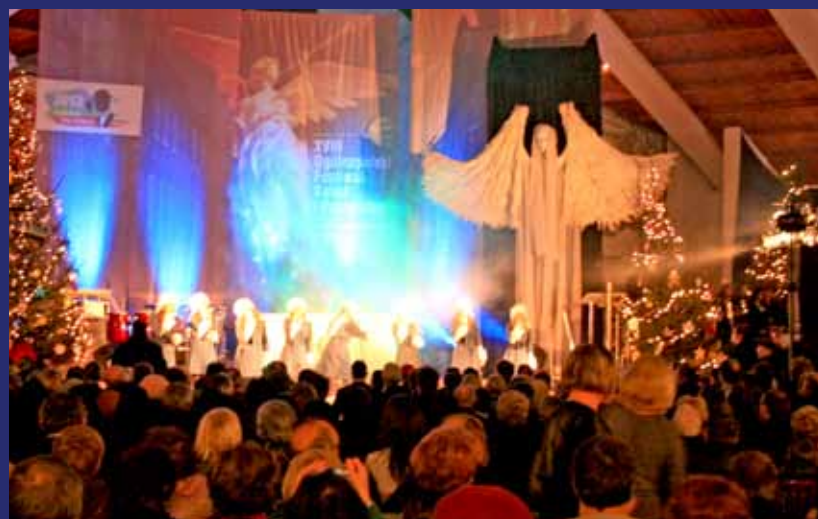
Zespół Szalone Małolaty z Elbląga- zdobywcy grand prix poprzedniej edycji Festiwalu.