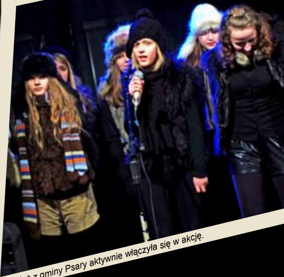
Młodzież z gminy Psary aktywnie włączyła się w akcję.