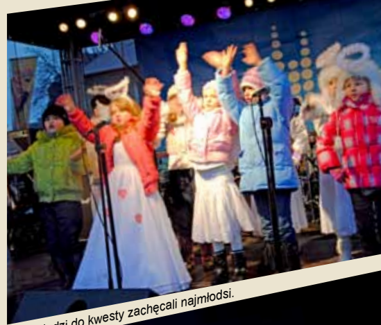
W Czeladzi do kwesty zachęcali najmłodszy.