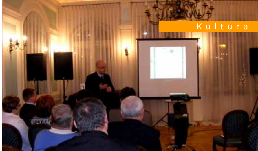
Podczas wernisażu można było poznać dawne regulacje prawne dotyczące przekraczania granic.

Dziś dzięki Układowi z Schengen, do którego Polska przystąpiła w 2007r. możemy swobodnie podróżować po znacznej części naszego kontynentu. Nad bezpiecznym przekraczaniem granic czuwa Straż Graniczna,