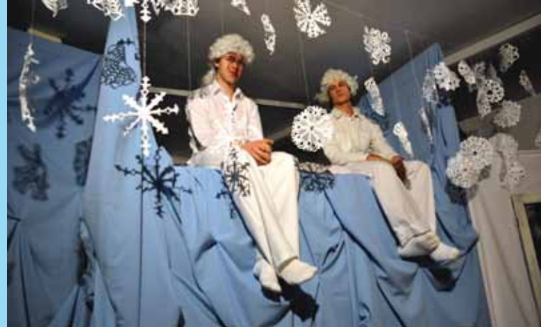
Szkolny chór przygotował najpiękniejszą polską kolędę.