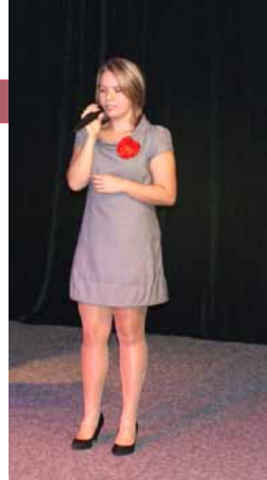
Konkurs przyciągnął wielu młodych artystów.

Od dziewięciu już lat w murach II LO im. St. Wyspiańskiego w Będzinie ma miejsce coroczne wydarzenie: koncert, w trakcie którego można podziwiać amatorskie występy uczniów wszystkich klas naszej szkoły oraz jej absolwentów.